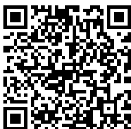
西条市企業ガイド